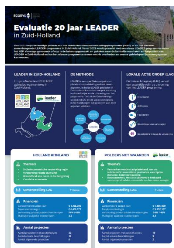
Figuur 3 Voorbeeld infographic