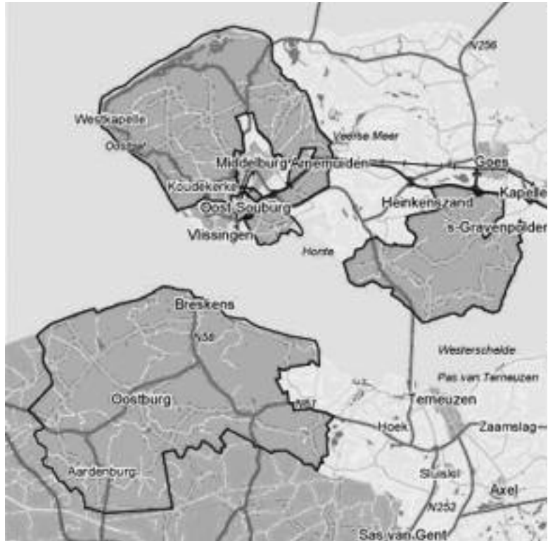
Figuur 2.1 Nationaal Landschap Zuidwest Zeeland

Daarnaast hebben pragmatische overwegingen een rol gespeeld bij de precieze afbakening: